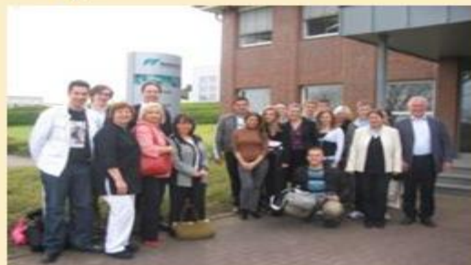
Spotkanie w Syke

„Nadzieje i obawy młodych Europejczyków” - zdobyliśmy trzecie miejsce w europejskim konkursie "EU Dialogue Award" organizowanym przez Centre for European Education.