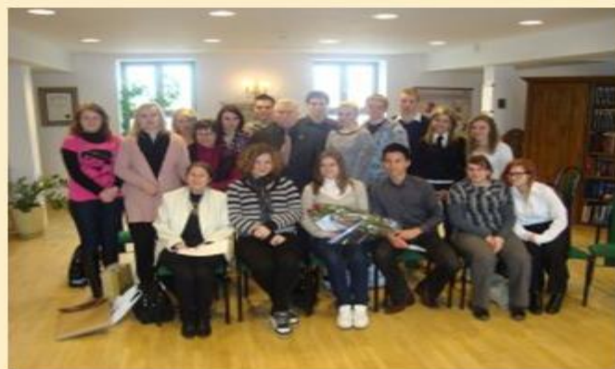
Spotkanie z Lechem Wałęsą w Gdańsku