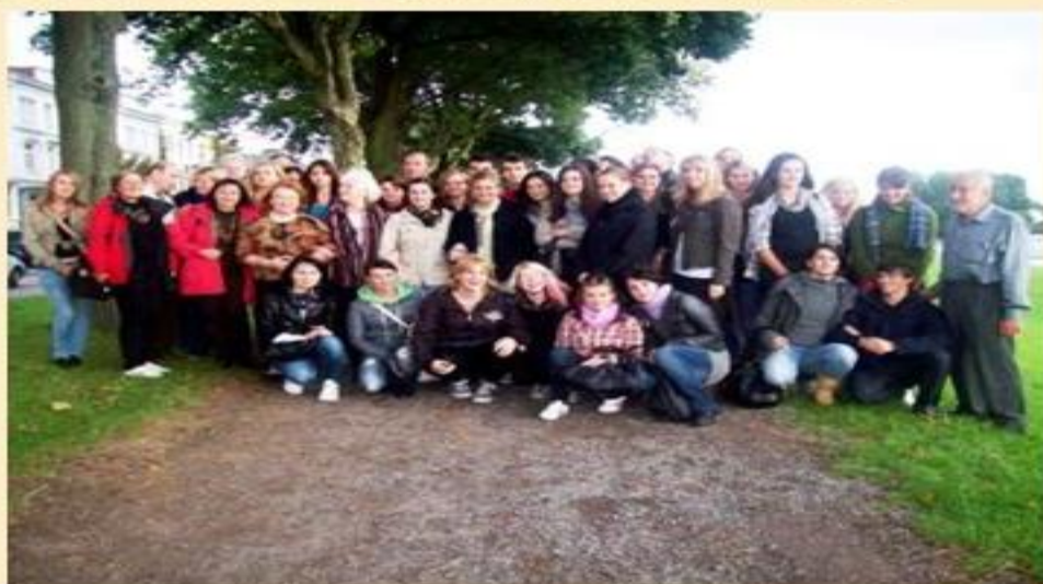
Spotkanie w Syke